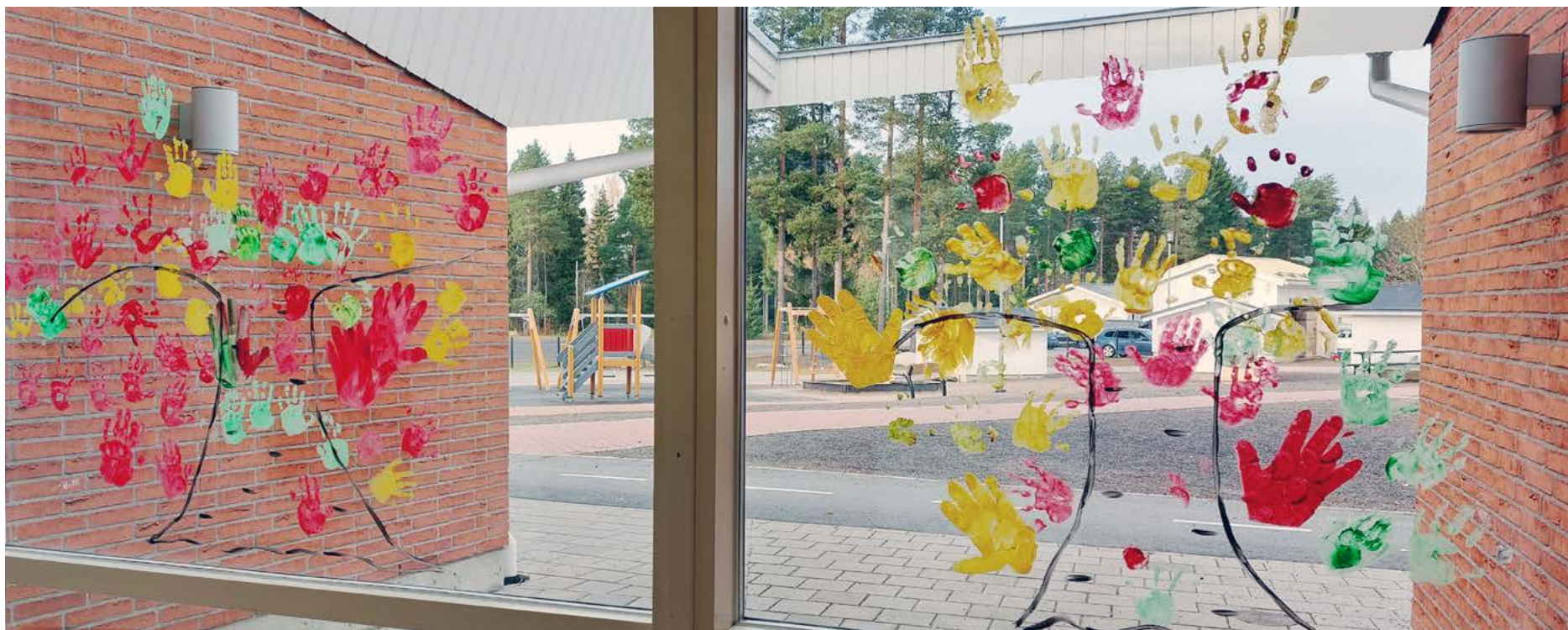
Sarkkirannan päiväkodin lasten ja aikuisten yhteinen taideviikon teos.

Kempele haki ja pääsi mukaan Unicefin Lapsiystävällinen kunta -toimintamalliin viime vuoden lopussa, joulun alla. Tämän vuoden aikana olen koordinaattorina tehnyt kartoitustyötä siitä, miten meillä Kempeleessä menee. Työskentelyä olen tehnyt monella eri tasolla mm. päättäjien, viranhaltijoiden, esihenkilöiden, nuorten aikuisten, sekä lasten ja nuorten kanssa. Viime viikolla olin mukana eskareiden unelmatyöpajassa miettimässä mitä turvallisuus lapsille merkitsee. Myös vanhemmilta on laajasti kysytty varhaiskasvatuksen vanhempainiloissa, mitä varhaiskasvatuksessa turvallisuus merkitsee. Tästä tullaan kertomaan tarkemmin mm. viikolla 46, joka on Lapsen oikeuksien viikko.