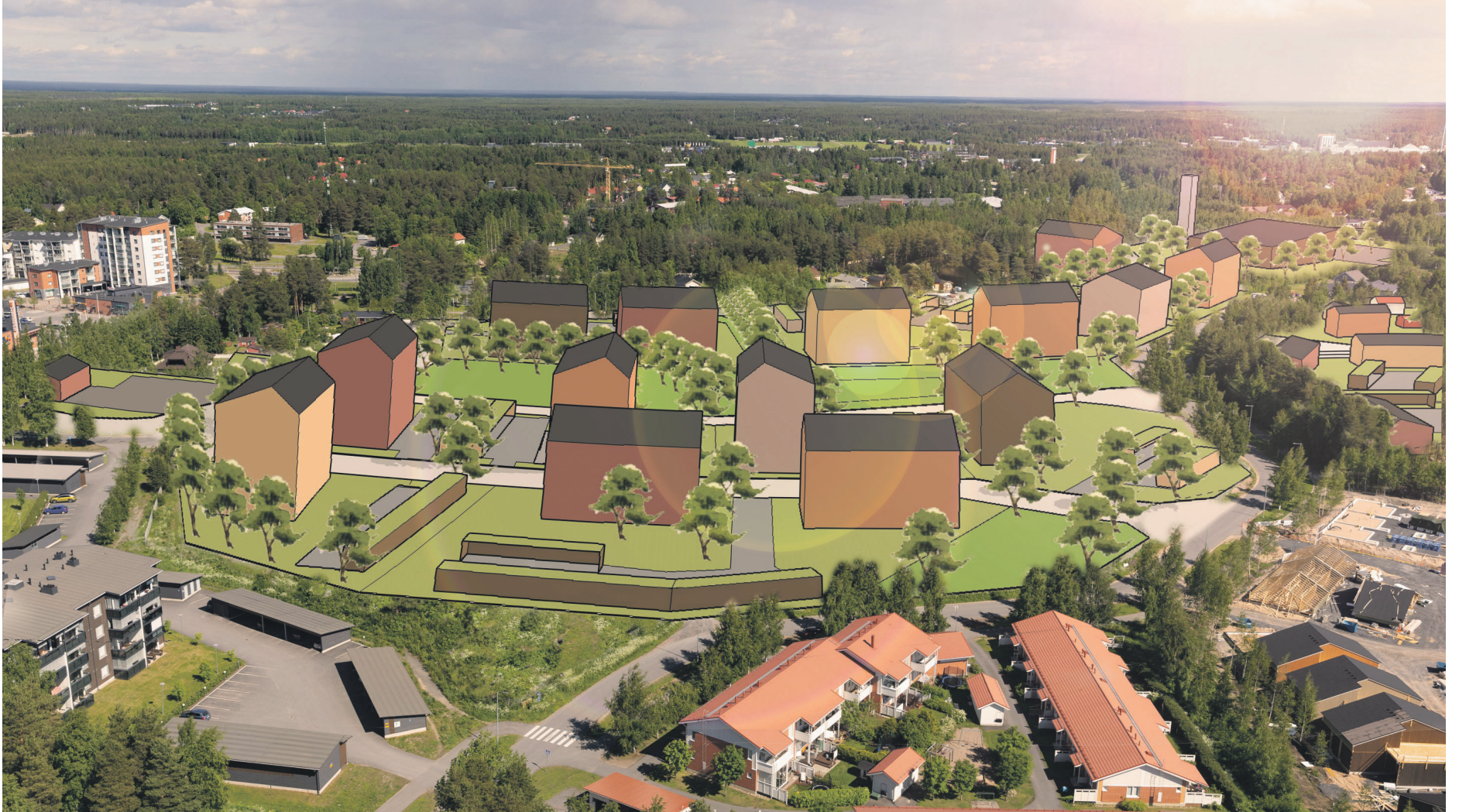
Näkymä lännestä Ollakan kerrostaloalueelle / Asemakaava-arkkitehti Reetta Lehtiranta.