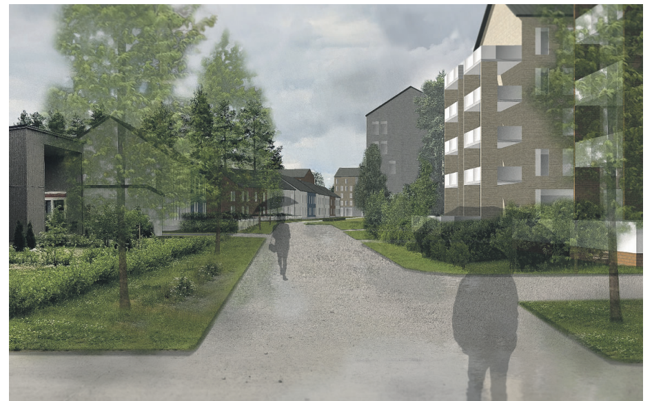
Näkymä Kaartotieltä rataa kohti. / Näkymä Suotieltä. / Yleiskaava-arkkitehti Eemeli Nurmi.