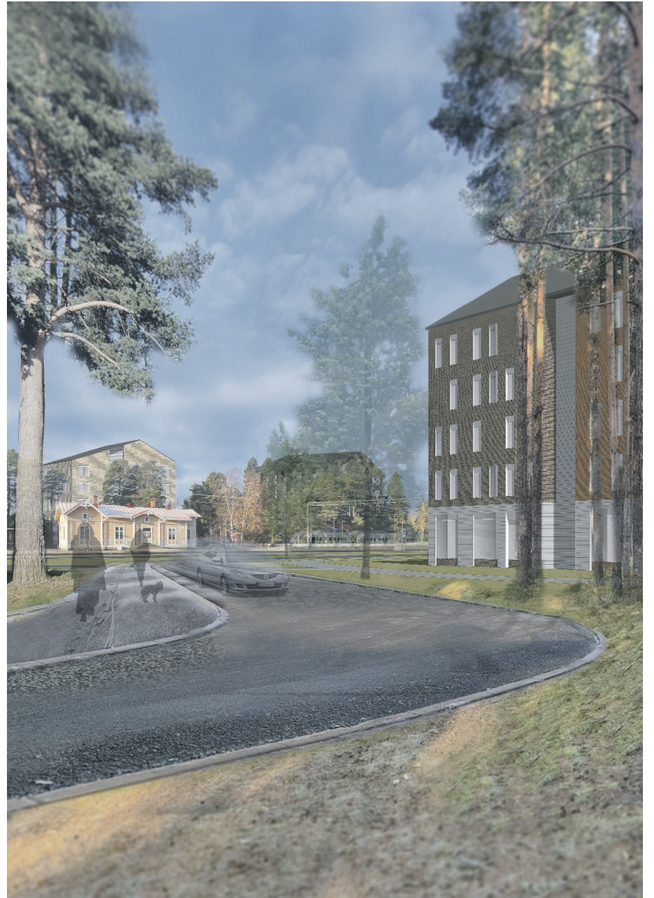
Näkymä uudelta kokoojakadulta asemarakennukselle päin. / Yleiskaava-arkkitehti Eemeli Nurmi.

Kunnan ohjelmiin ja kehittämissuunnitelmiin voi tutustua lisää osoitteessa www.kempele.fi/asuminen-ja-ymparisto/suunnitelmapankki/muut-suunnitelmat-ja-selvitykset.html