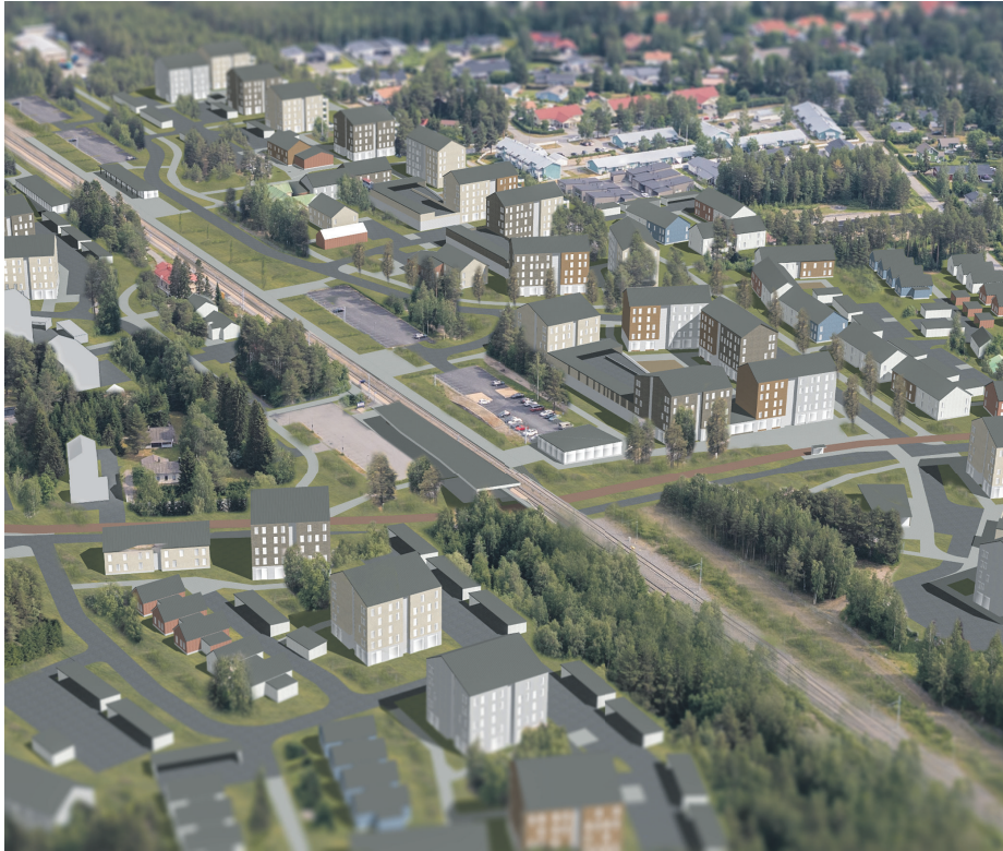
Voiko Kempeleen aseman ympäristö näyttää joskus tältä? Visualisointi yleiskaava-arkkitehti Eemeli Nurmi.

Kunnan tulee maankäyttö- ja rakennuslain (MRL § 7) mukaan laatia vähintään kerran vuodessa katsaus kunnassa ja maakunnan liitossa vireillä olevista ja lähiaikoina vireille tulevista kaava-asioista, jotka eivät ole merkitykseltään vähäisiä. Kempeleen kunnanhallitus hyväksyi katsauksen sisällön 9.9.2024 § 280 kokouksessaan.