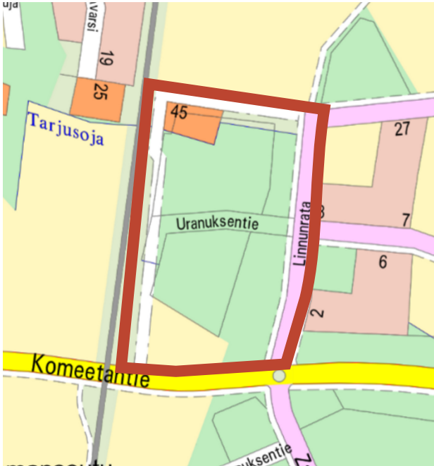
Kartta 1 ote opaskartasta, johon on merkitty asemakaava, jota rakentamistapaohje koskee (punainen yhtenäinen viiva).

Nämä rakentamistapaohjeet täydentävät kunnanvaltuuston 00.00.0000 § 0 hyväksymää Kempeleen asemakaavan muutosta ja laajennusta Zateelliitin yritysalueelle.