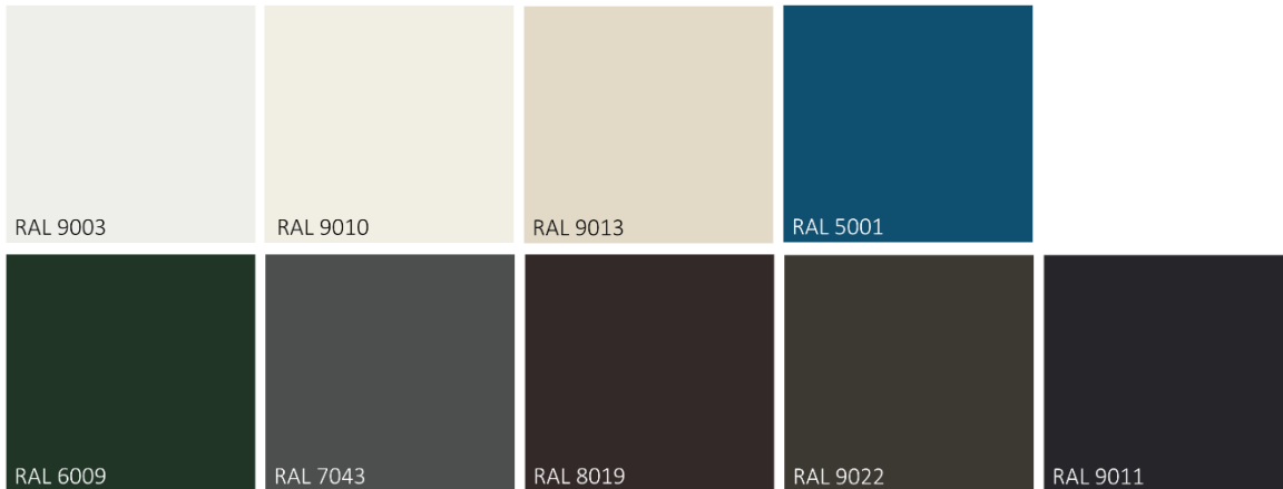
Kuva 1 Kaava-alueella käytettävien julkisivujen päävärien värikartta. Väri voi olla kartassa esitetty sävy tai sitä vastaava toinen sävy. Värikartta ei sido aksenttivärejä.

Julkisivuissa tulee käyttää laadukkaita ja kestäviä materiaaleja, jotka takaavat alueen yleisilmeen siisteyden myös tulevaisuudessa.