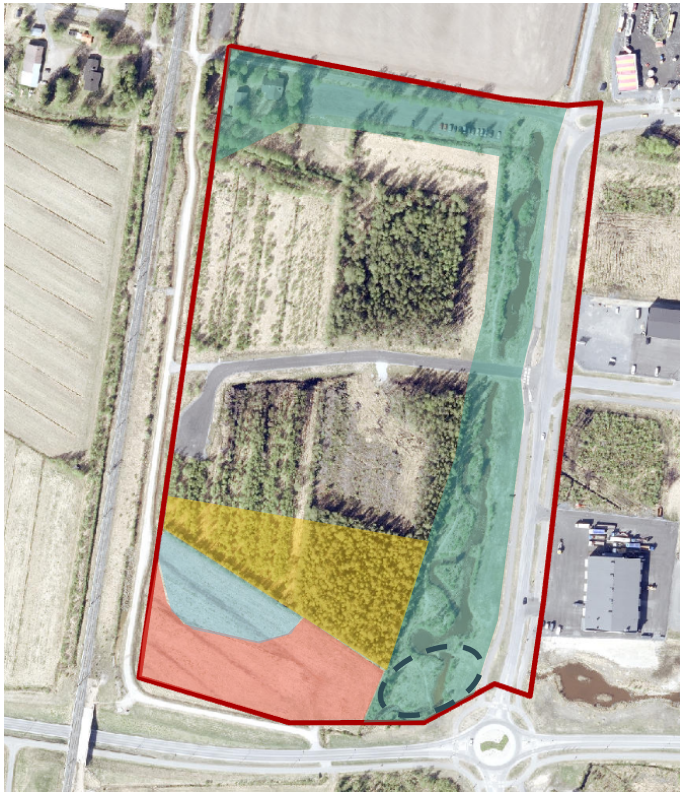
Kartta 2 Kartassa on esitetty suuntaa antavasti eriluonteisten viheralueiden sijainnit, sekä tontinosa, joka säilytetään puustoisena, kunnes kyseistä tontinosaa tarvitaan tontin rakentamista tai pihan käyttöä varten.

Kaava-alueelle muodostuvaa teollisuuden tonttia ympäröi viheralueet, joissa kulkee hulevesien hallinnan kannalta merkittävä kosteikko, sekä nykyisellään maatalouskäytössä oleva pelto, joka on tarkoitus metsittää. Alueet on jaettu kaavassa kahdeksi eri kokonaisuudeksi. Kummankin alueen tavoitteena on muodostaa pitkällä aikavälillä luonnon monimuotoisuutta tukevat mahdollisimman luonnonmukaiset viheralueet.